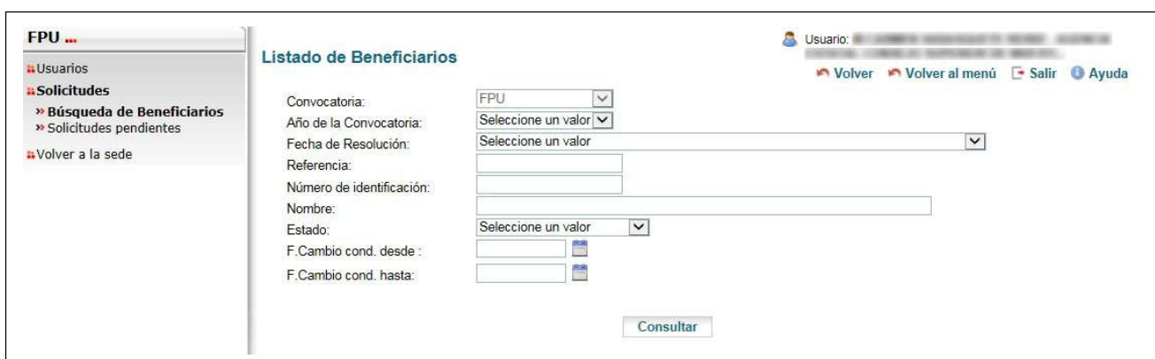
Figura 3.1.2. Búsqueda de Beneficiarios

3.1.2. En la pantalla de inicio, en el menú de la izquierda hacer clic sobre Búsqueda de Beneficiarios , introducir los datos para acceder al expediente y Consultar (Figura 3.1.2.).