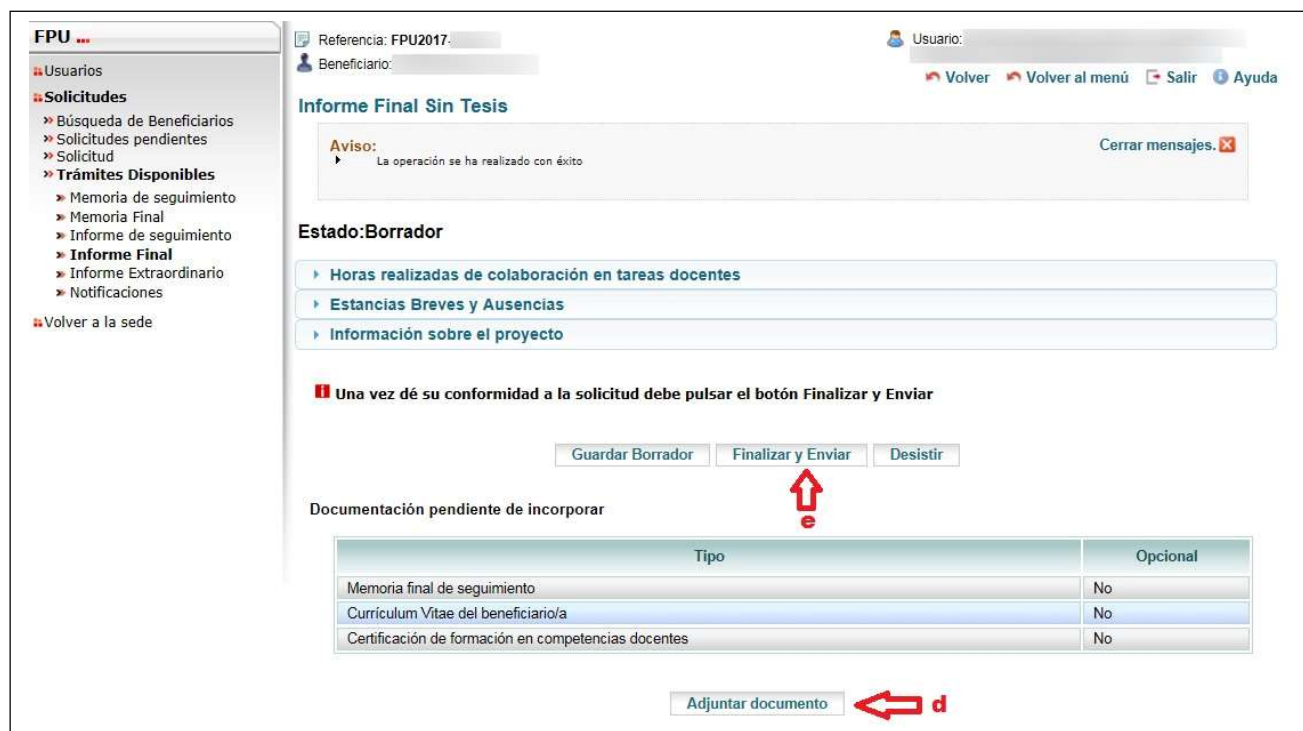
Figura 3.2.b. Trámites Disponibles – Informe Final Sin Tesis – Finalizar y enviar