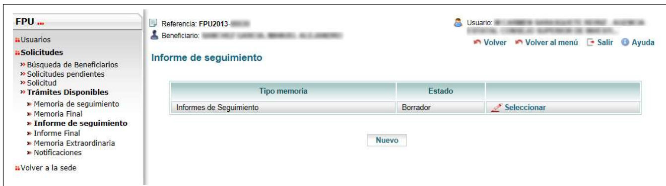
Figura 3. Trámites Disponibles – Informe de seguimiento – Nuevo