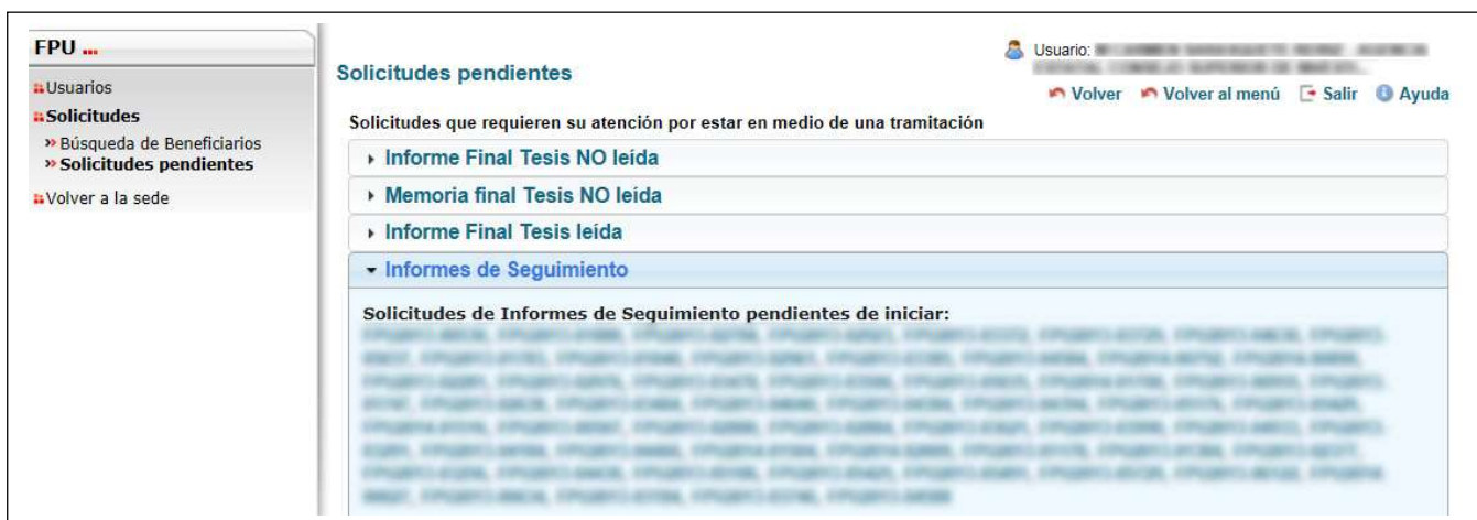
Figura 2. Informes de Seguimiento